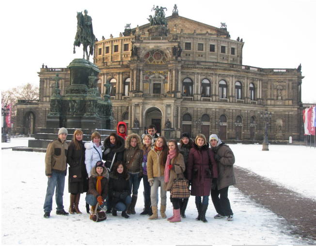
To begin with...Dresden. The city of great architecture, old history and creative people. The most famous thing – Dresden painting gallery, where you can find the original paintings of Rubens, Rembrandt and, sure, Rafael.