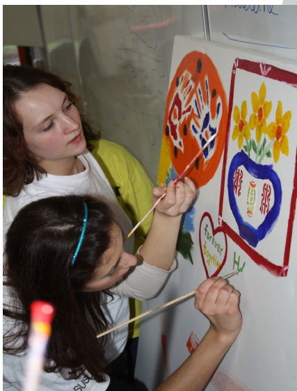
Forever together, forever friends