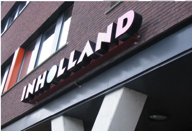
Inholland University of Applied Sciences – powerful university, situated in Alkmaar.