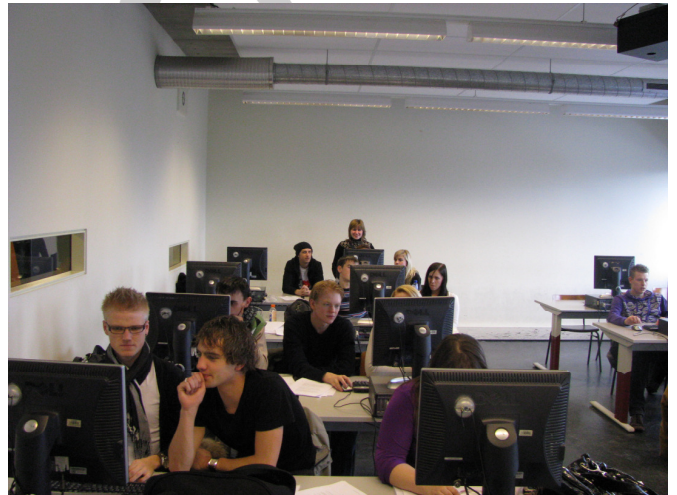
The process of making important decisions during the simulation business game.