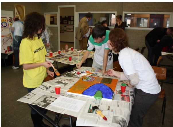
Painting workshop: Ukraine and Netherlands by students' eyes